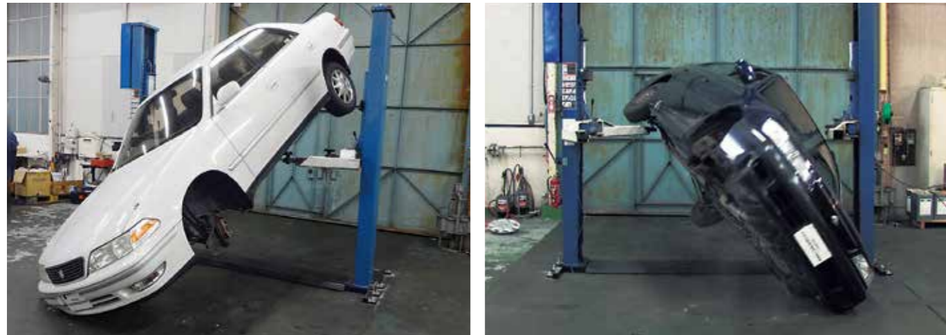
荷重バランスが悪い状況でのリフトアップによる車両落下検証実験写真