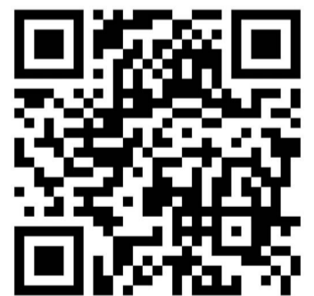
事前登録はこちらから

日本自動車機械工具協会（機工協、柳田昌宏会長）は、日本最大の整備機器の展示会「第37回オートサービスショー2023」を6月15～17日に東京ビッグサイト（東京都江東区）で開催する。通常は隔年で実施しているが、21年度は新型コロナウイルス感染症拡大防止の影響や会場の都合などで中止したため、4年ぶりの開催となる。出展者数は95社・7団体、屋内940、屋外10小間。3日間で5万人の来場を見込む。