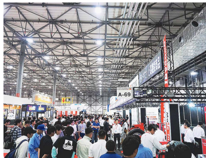
前回のオートサービスショー

19年度に開催した前回のショーは東京ビッグサイトの青海展示棟A・Bホールを会場に103社・8団体が出展し、3日間で3万7245人が来場した。